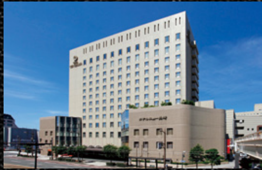
▲「ホテルニュー長崎」外観

和洋中の粋が集まる ホテルニュー長崎ならではの三段重。 選び抜かれた食材と最高の技がおもてなしを 美味しく彩ります。