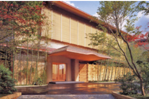
▲「美濃吉本店 竹茂楼」外観

美濃(岐阜)出身の当主が始めた、川魚を主体とした料理屋として京料理の心をお伝えする美濃吉。 おせち料理の伝統に則った料理で構成しながら、甘・辛・酸など全体で五味を味わって頂ける、味の濃淡を大切にしています。