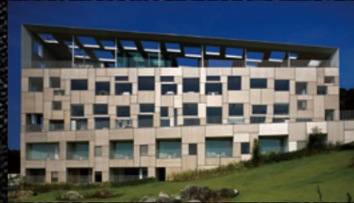
▲「ガーデンテラス長崎ホテル&リゾート」店舗外観

ガーデンテラス長崎ホテル&リゾート 特製和洋折衷おせち ホテル内レストラン4店舗の 各料理長豪華コラボ三段重。