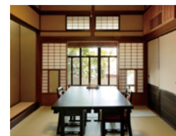
▲「料亭 あおぎり」店舗内観