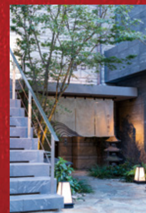
▲「大衆割烹 樋口」店舗外観