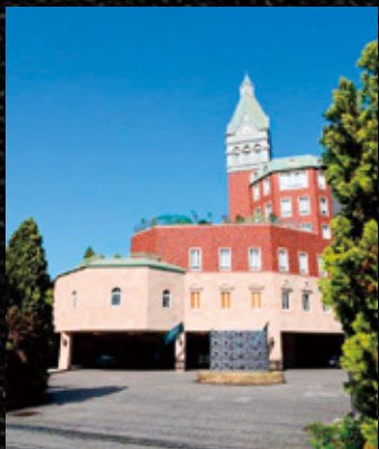
▲「ロイヤルチェスター長崎ホテル&リゾート」外観

お正月を華やかに演出する ロイヤルチェスター長崎ホテル&リゾートの おせち料理。昔ながらのお料理に近代風のお料理を 織り交ぜ、伝統を守りつつ洗練されたお料理は より深く冴えた味わいをご堪能下さいませ。