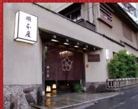
▲「料亭 坂本屋」店舗外観

限定数50 4 和風一段重 おせち 700045 3人前 お重サイズ / 31.5×23.5×4.5cm 28,500円 (税込) ネット