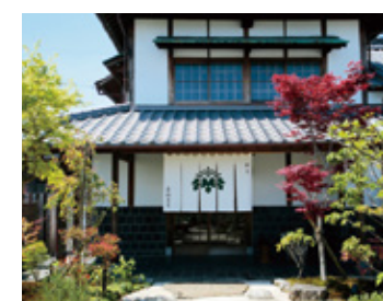
▲「料亭 あおぎり」店舗外観