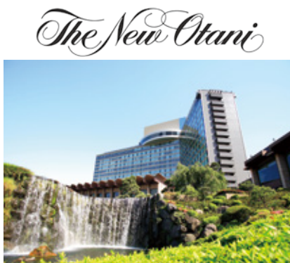
▲「ホテルニューオータニ」店舗外観